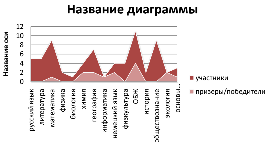
Рис. 2. Соотношение участников и призеров муниципального этапа Всероссийской олимпиады по предметам в 2012-2013 уч.г.

Из диаграммы 2 видно, что по большинству предметных дисциплин было представлено участниками от школы результативно. Кроме того, соотношение числа участников и призеров олимпиады по ряду дисциплин (химия, экология, ИКТ, немецкий язык) колебалось в пределах 50 – 100%.